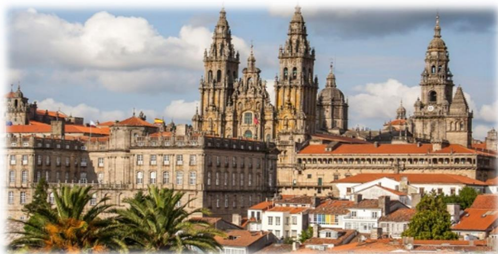
Santiago de Compostela

Tour garantito, in pullman, con 4 brevi percorsi a piedi di 8 giorni / 7 notti, con guida in italiano